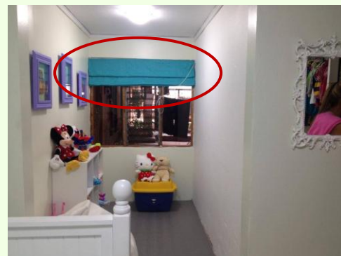
Persiana Romana