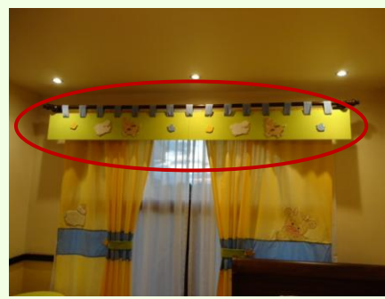
Cenefa decorativa